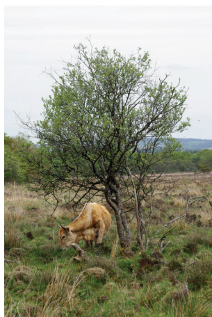
Une vache nantaise en tourbière

Soucieux de mieux connaître et protéger les tourbières dans la région, le Conservatoire d'espaces naturels (CEN) des Pays de la Loire et ses partenaires se sont mobilisés pour élaborer un Programme régional d'actions en faveur des tourbières : le PRAT. Ce dernier se donne pour objectifs de mettre à jour les connaissances sur les tourbières, de rassembler collectivités et autres acteurs de l'environnement et d' impulser des dynamiques locales pour sauvegarder ces milieux .