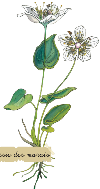
La Parnassie des marais