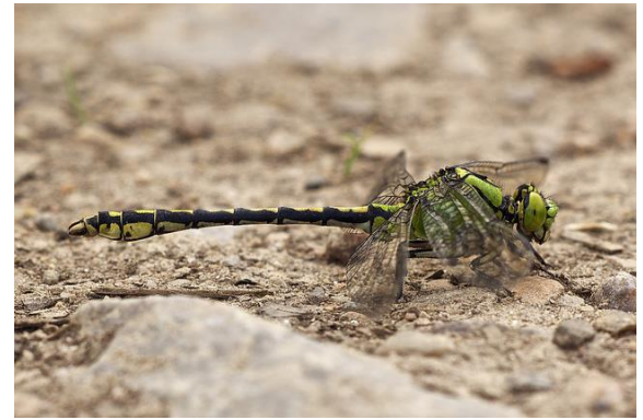
Gomphe à pattes jaunes