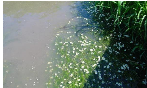
Rivière avec végétation flottante de Renoncules