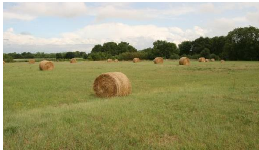
Prairie maigre de fauche

Estelle Ngoh : 02.28.20.51.64 e.ngoh@cenpaysdelaloire.fr