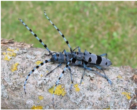
Rosalie des Alpes