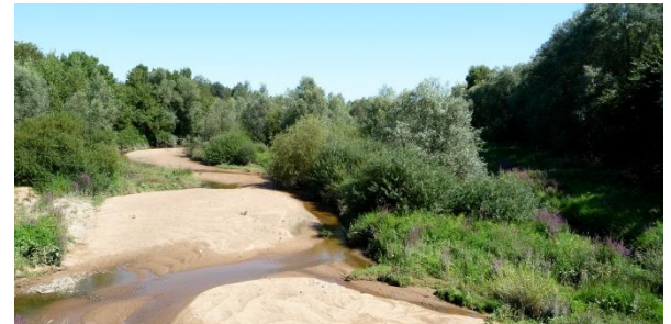
Mégaphorbiaie et Forêt alluviale